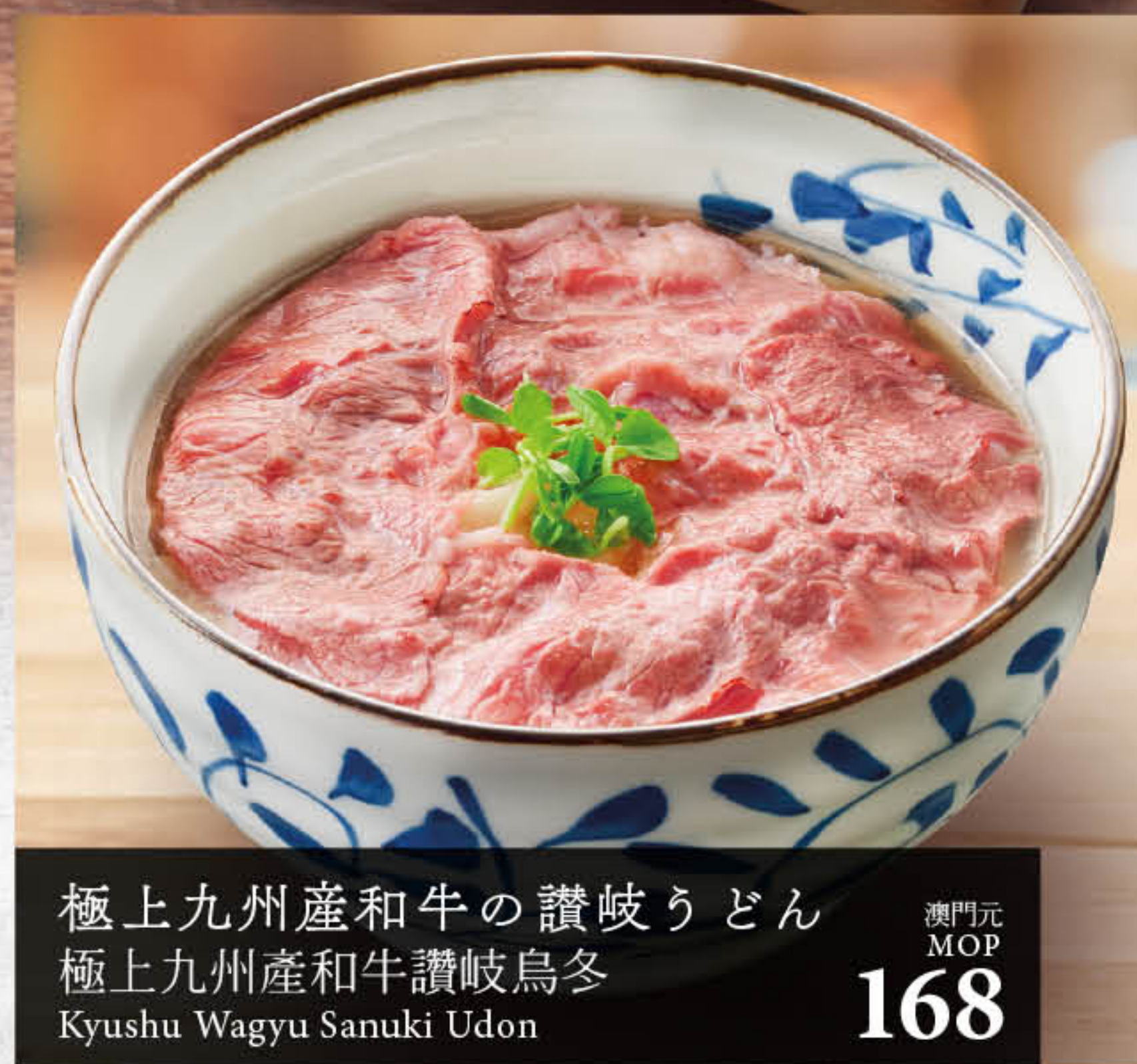
極上九州産和牛の讃岐うどん 極上九州産和牛讃岐烏冬 Kyushu Wagyu Sanuki Udon