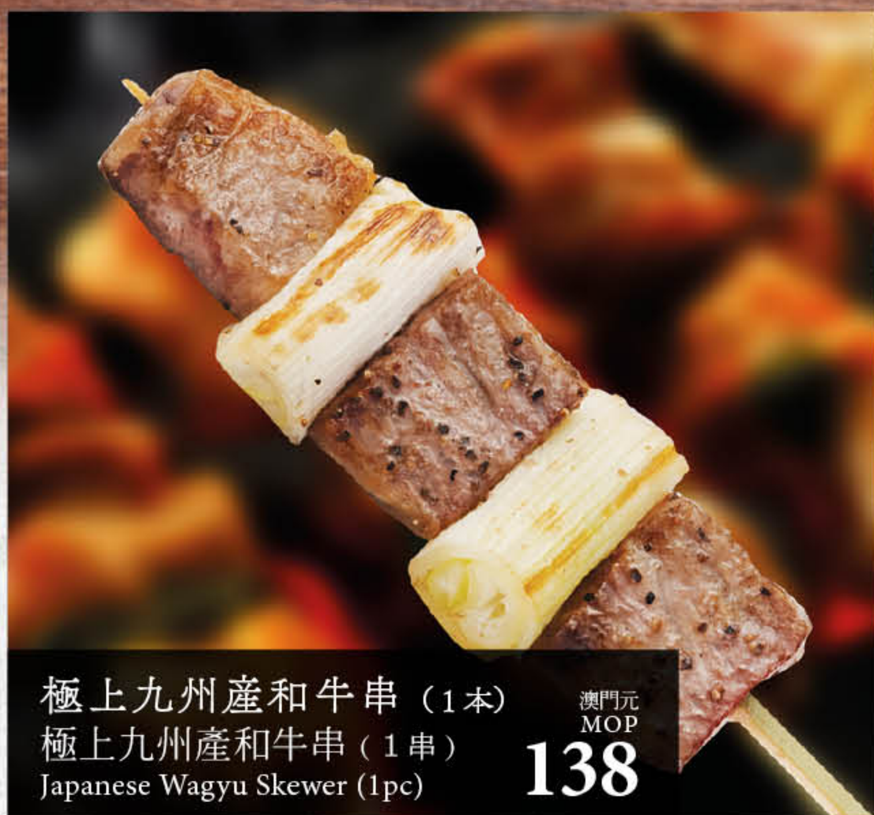
極上九州産和牛串 (1本) 極上九州産和牛串 (1串) Japanese Wagyu Skewer (1pc)