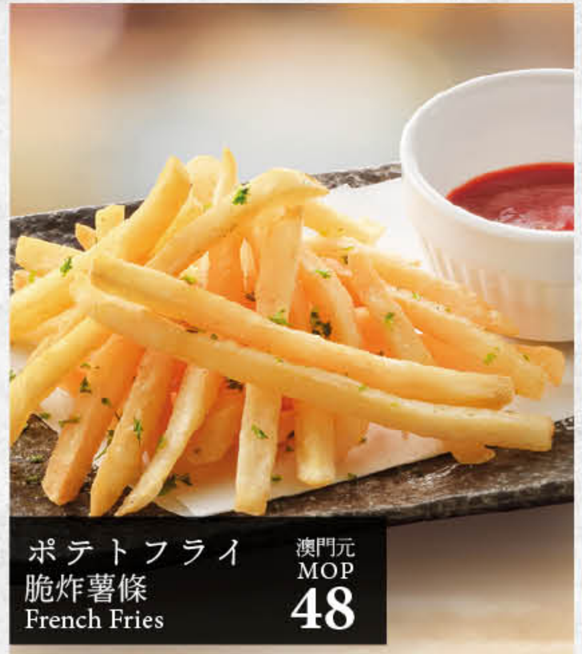
ポテトフライ 脆炸薯條 French Fries 澳門元 MOP 48