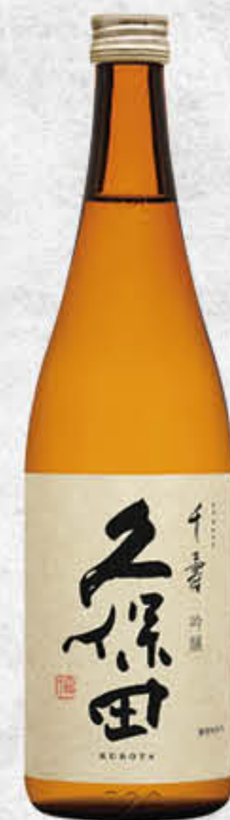
久保田千壽吟釀 澳門元 MOP 528 久保田千壽吟釀