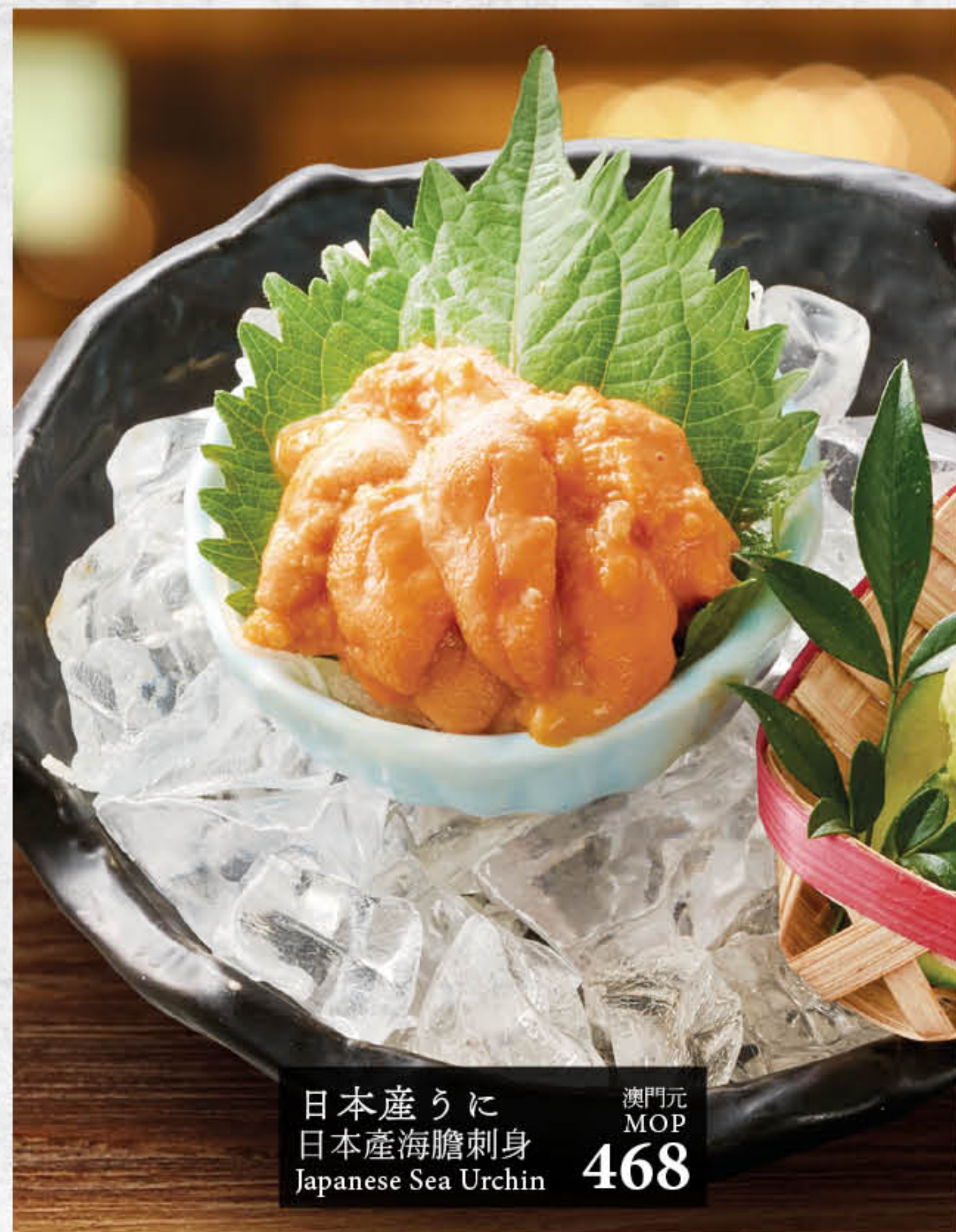
日本産うに 日本産海膽刺身 Japanese Sea Urchin 澳門元 MOP 468