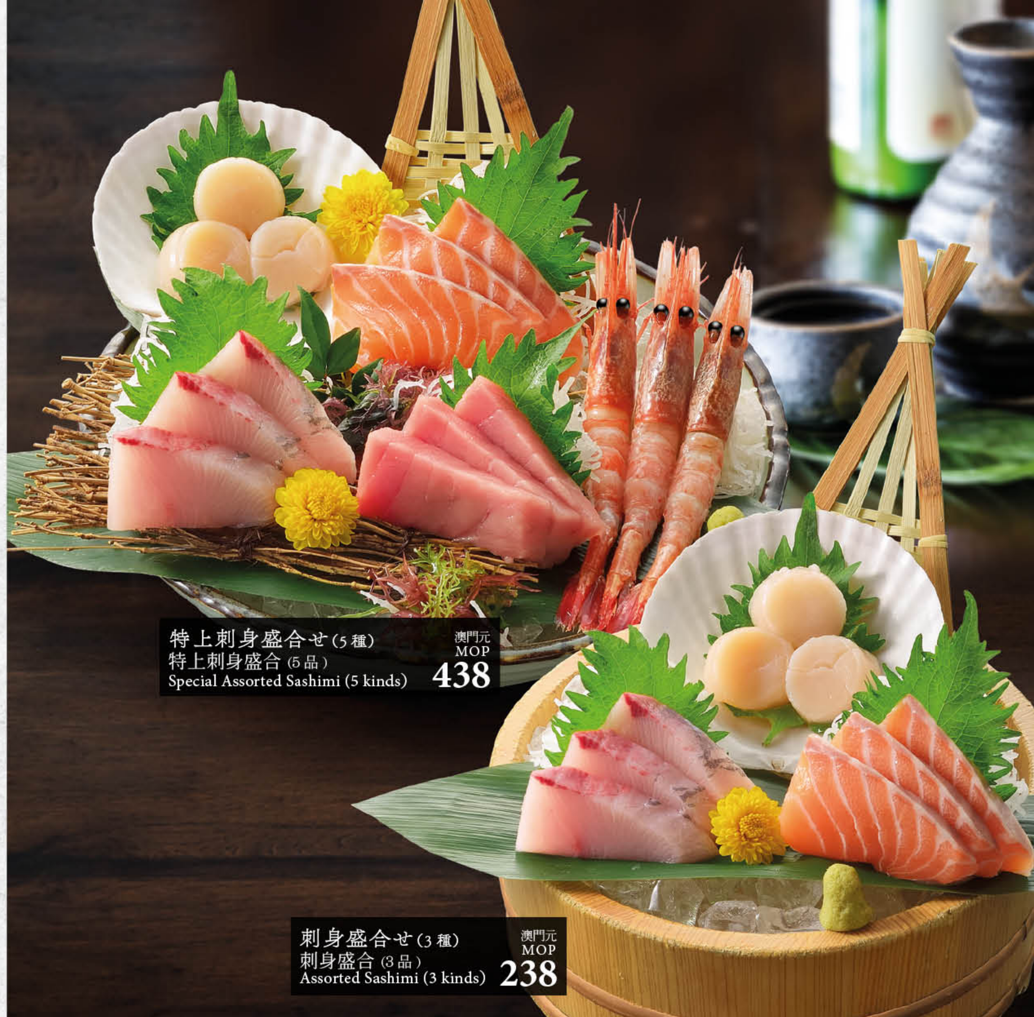
特上刺身盛合せ (5種) 特上刺身盛合 (5品) Special Assorted Sashimi (5 kinds) 澳門元 MOP 438