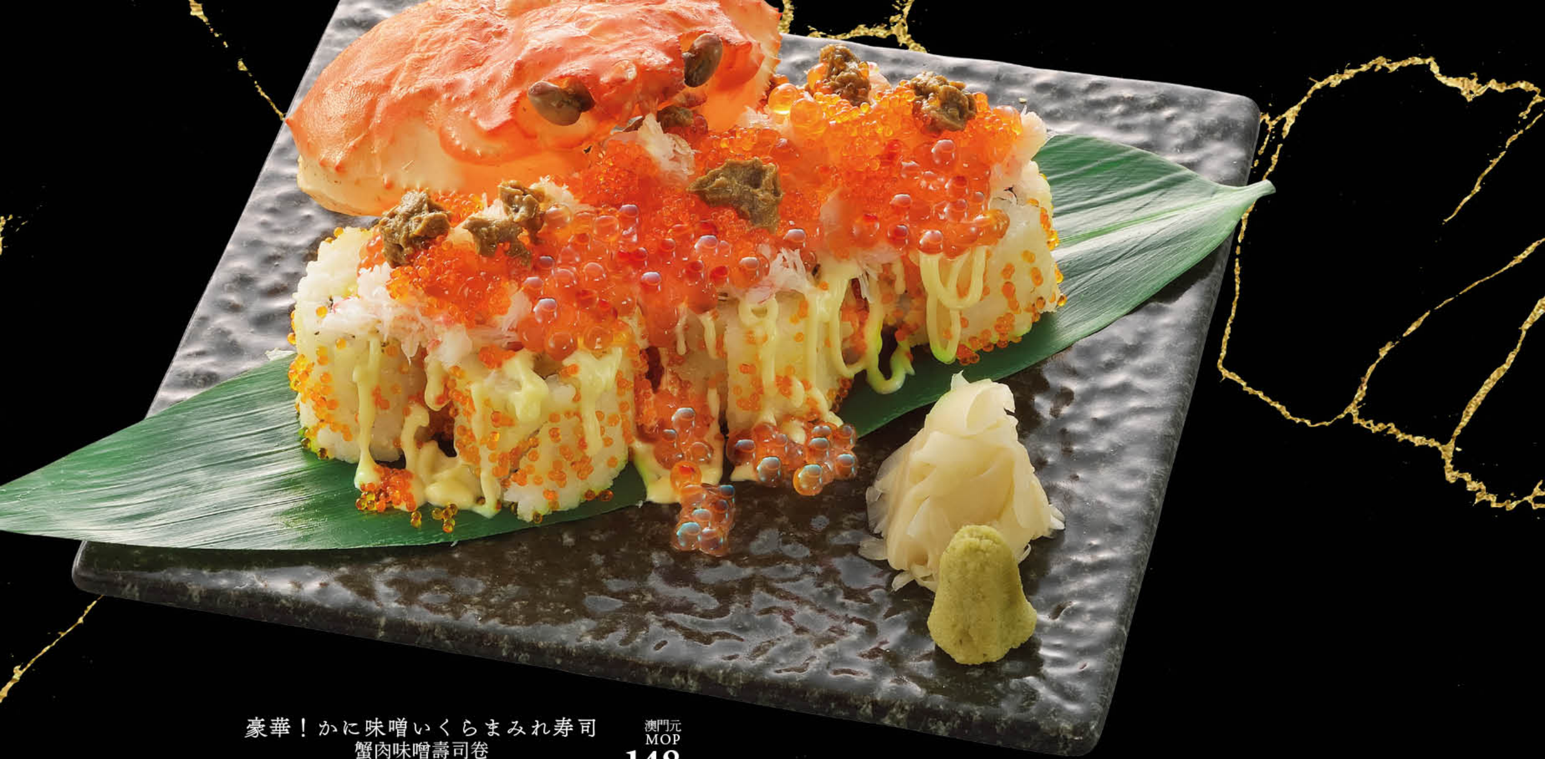
豪華！かに味噌いくらまみれ寿司 蟹肉味噌壽司卷 Crab Meat with Crab Paste Roll Sushi