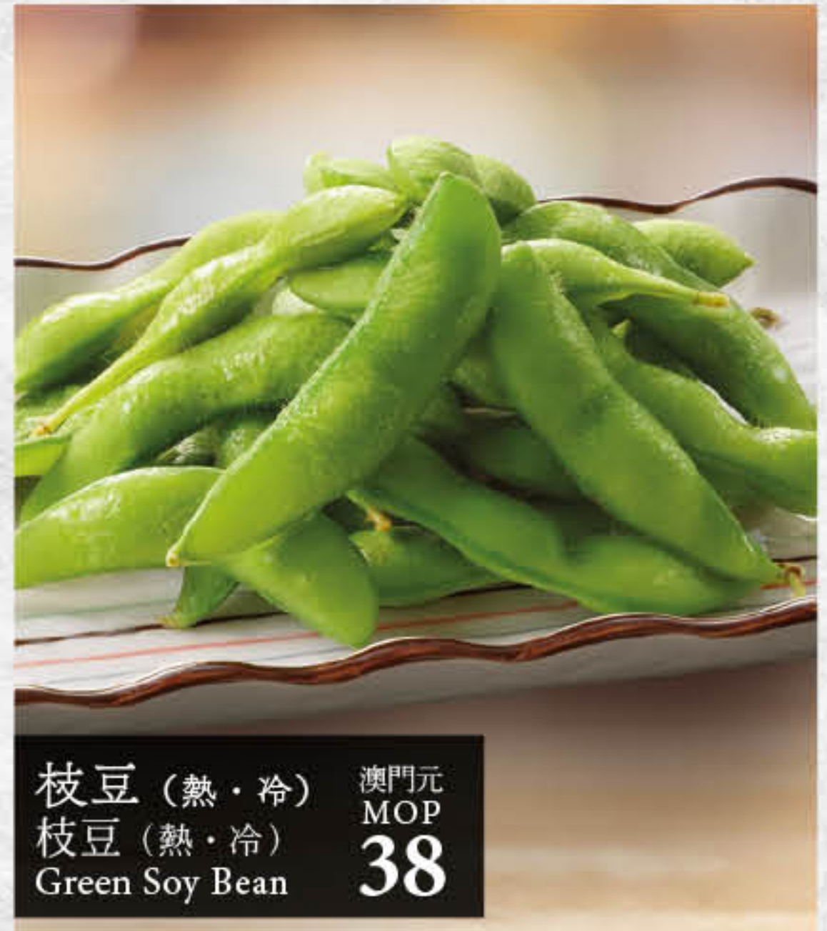
枝豆 (熱・冷) 枝豆 (熱・冷) Green Soy Bean 澳門元 MOP 38