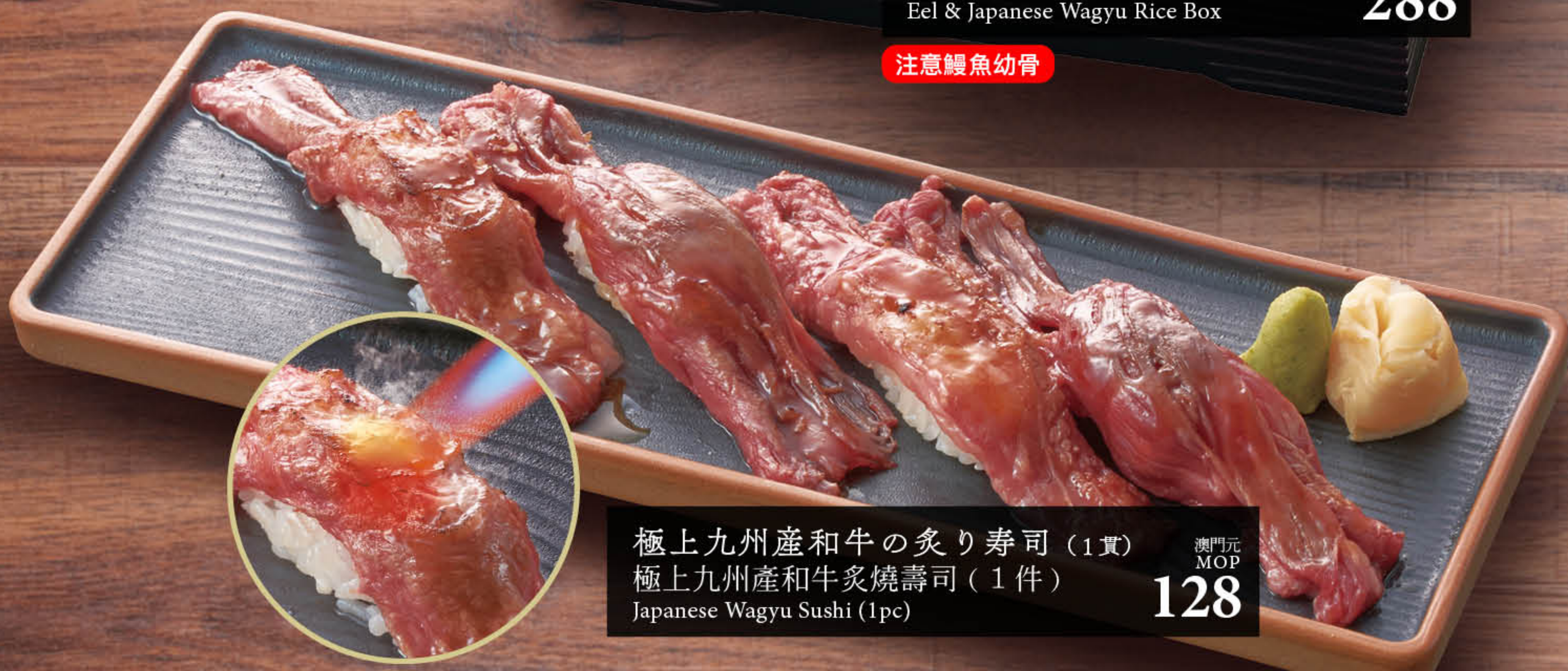
極上九州産和牛の炙り寿司 (1貫) 極上九州産和牛炙焼寿司 (1件) Japanese Wagyu Sushi (1pc)