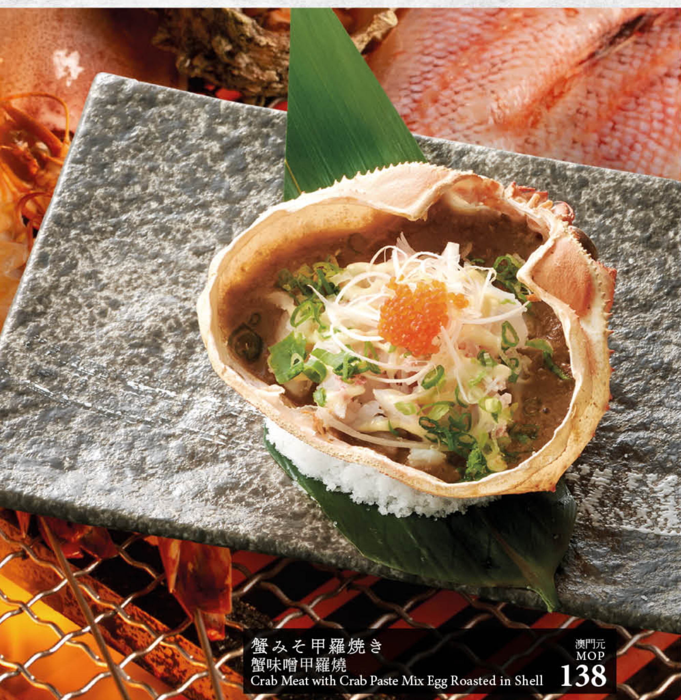
蟹みそ甲羅焼き 蟹味噌甲羅燒 Crab Meat with Crab Paste Mix Egg Roasted in Shell