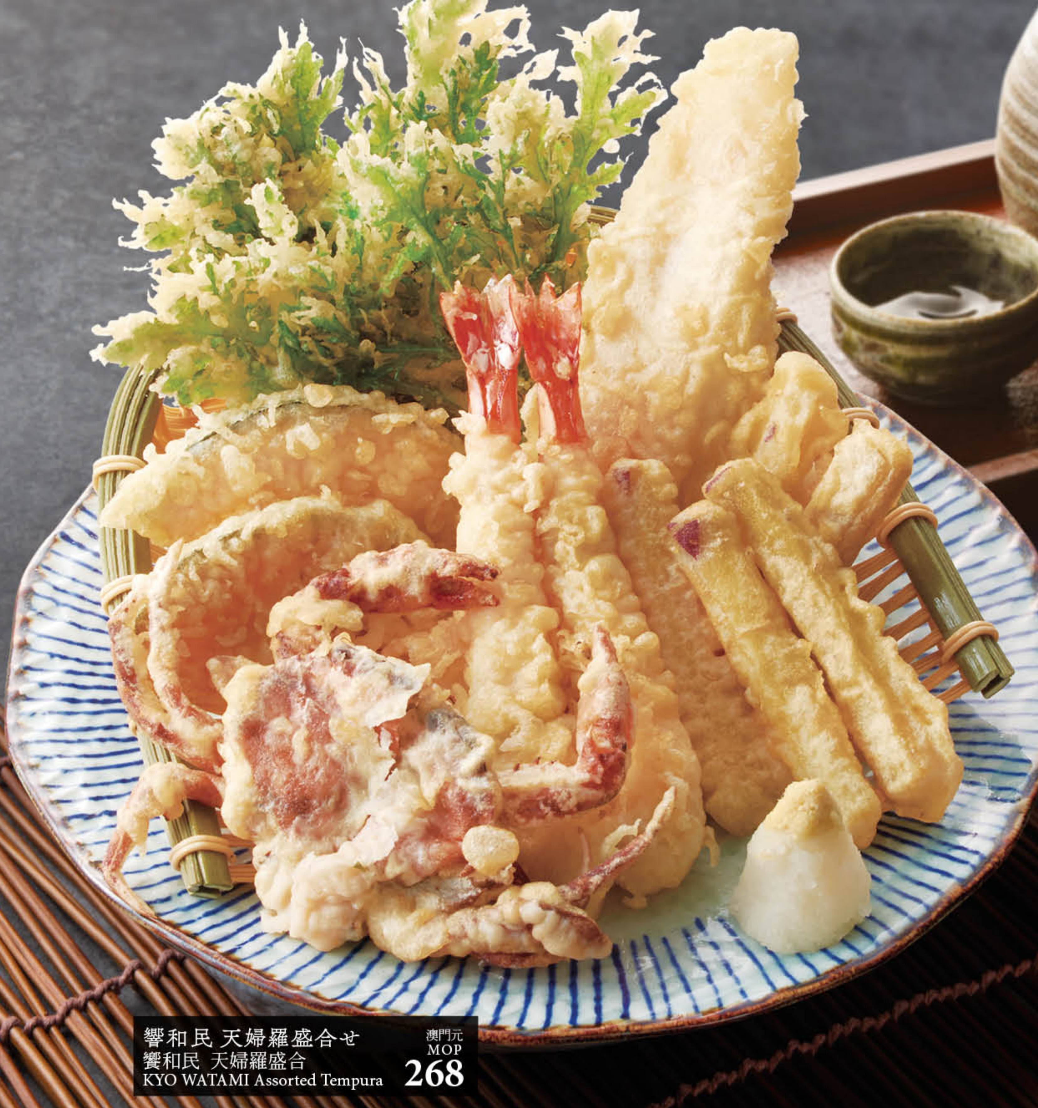
響和民 天婦羅盛合せ 響和民 天婦羅盛合 KYO WATAMI Assorted Tempura 澳門元 MOP 268

以傳統的天婦羅形式呈現的野菜及海鮮， 都是我們精心挑選的。請細心品嚐其香脆、 極尚的口感。