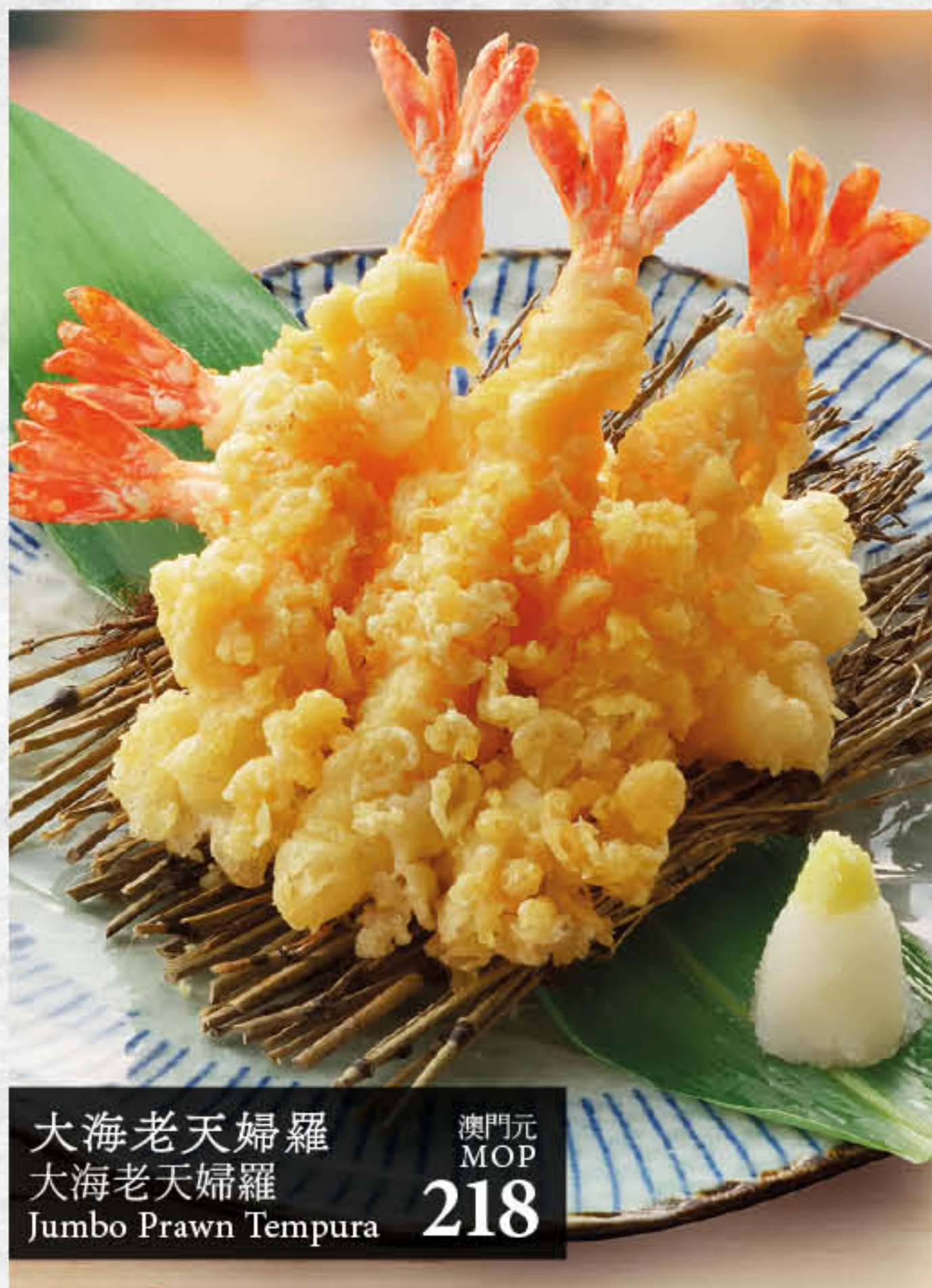
大海老天婦羅 大海老天婦羅 Jumbo Prawn Tempura 澳門元 MOP 218