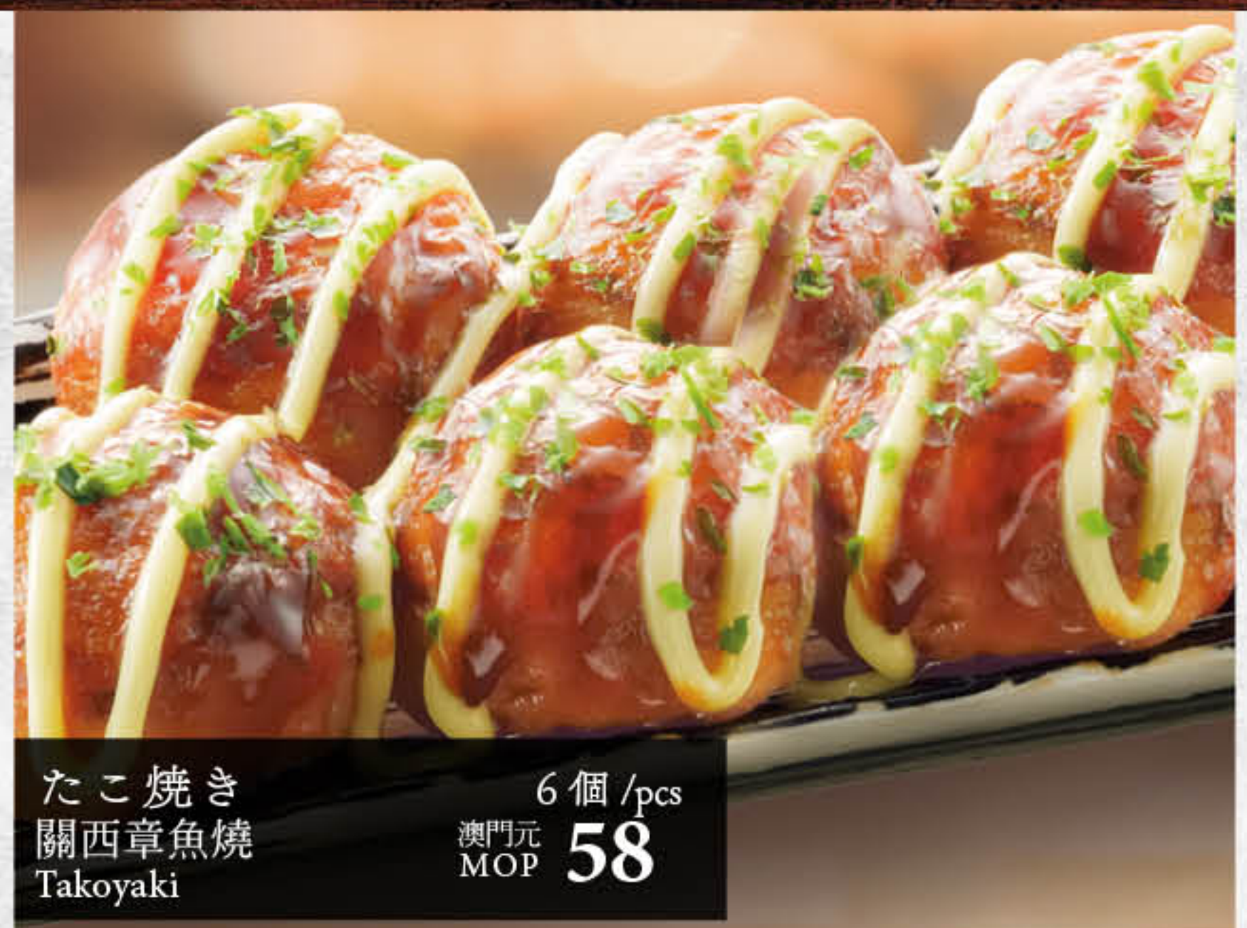
たこ焼き 關西章魚燒 Takoyaki 6個 / pcs 澳門元 MOP 58