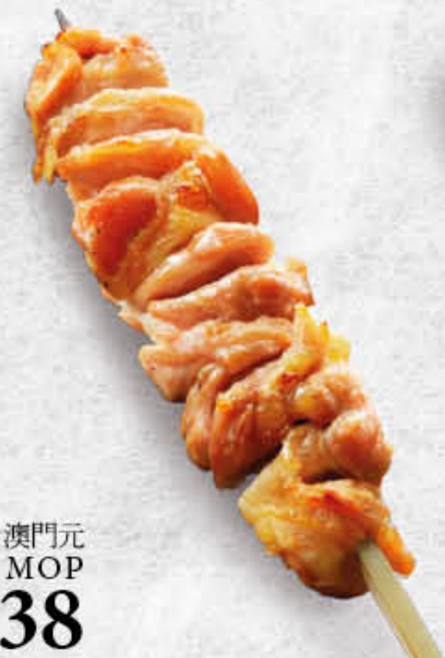
豚ロース串 豚肉串 Japanese Pork Skewer