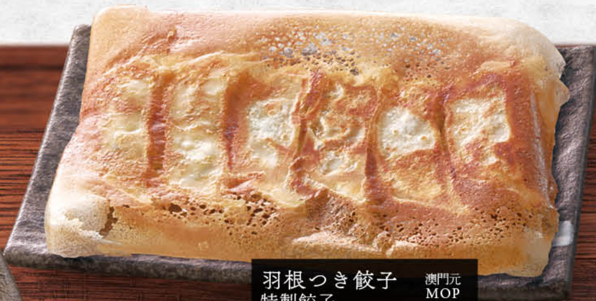
羽根つき餃子 特製餃子 Special Dumpling 澳門元 MOP 68