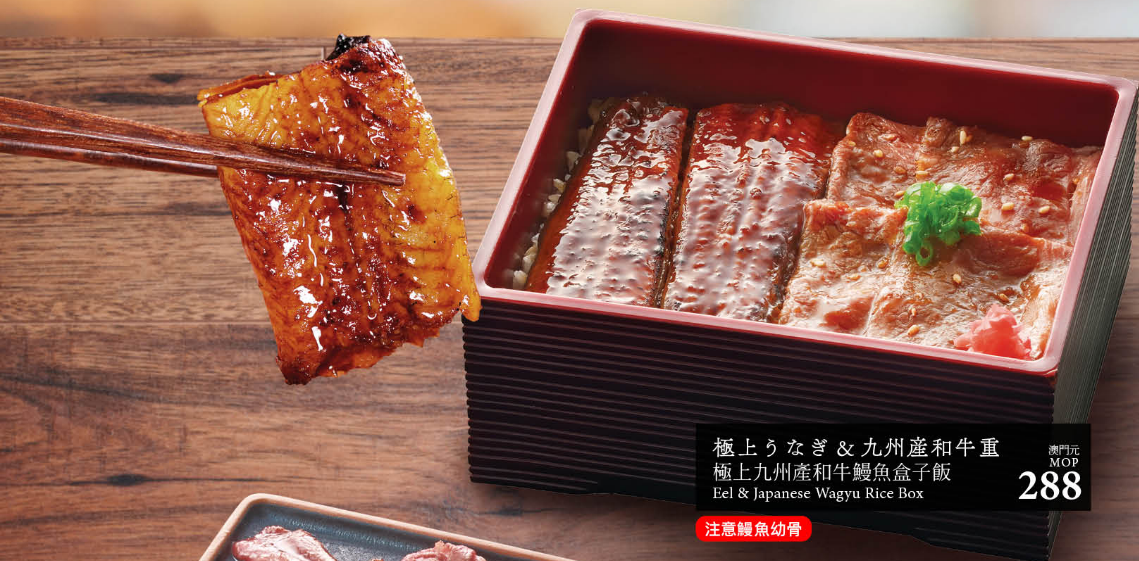
極上うなぎ & 九州産和牛重 極上九州産和牛鰻魚盒子飯 Eel & Japanese Wagyu Rice Box