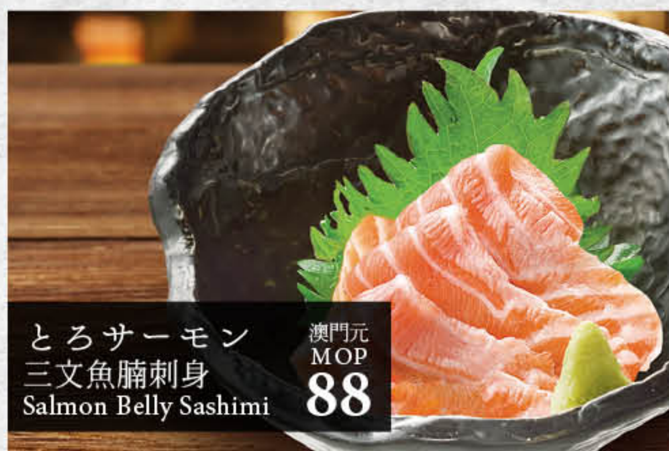
とろサーモン 三文魚腩刺身 Salmon Belly Sashimi 澳門元 MOP 88