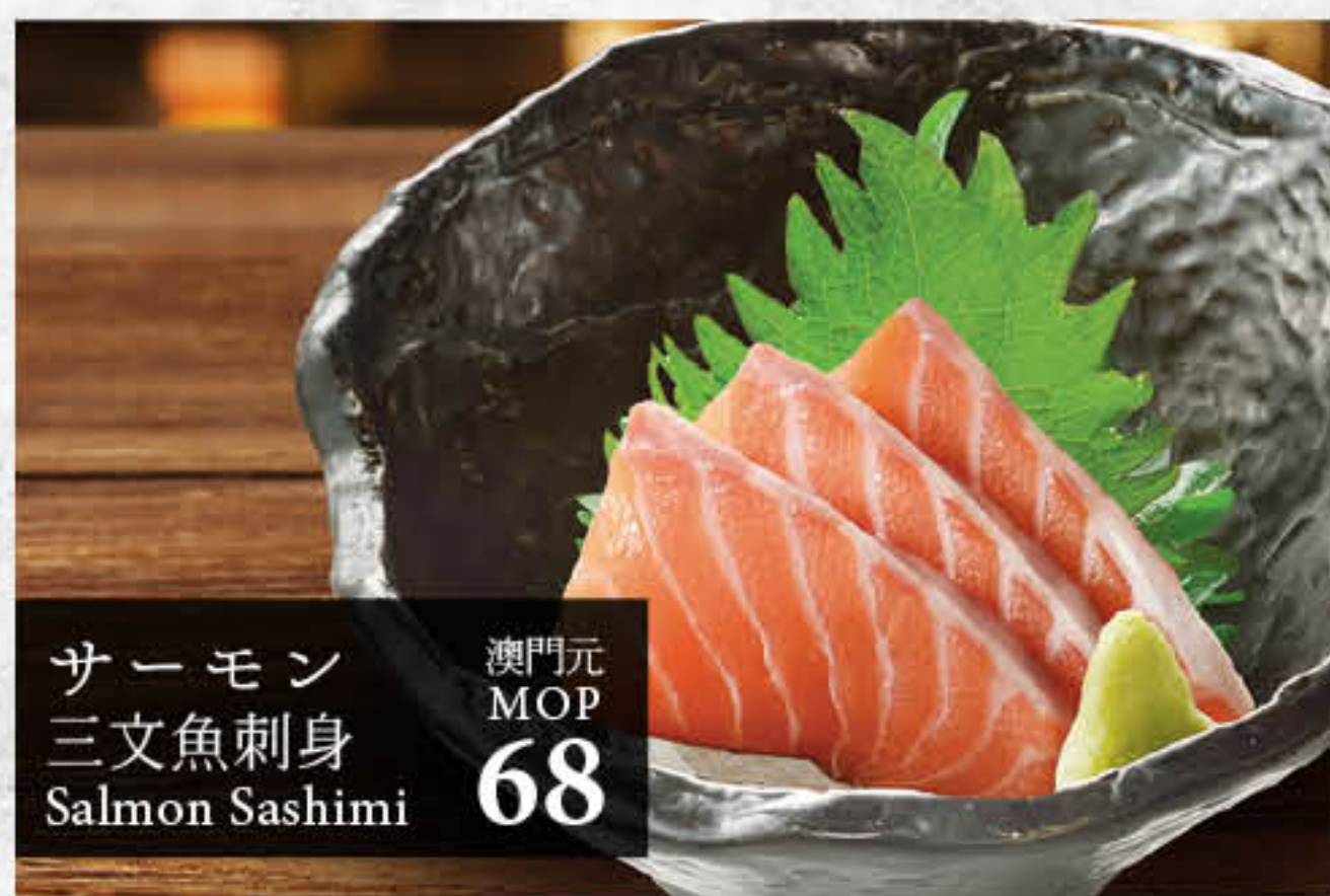
サーモン 三文魚刺身 Salmon Sashimi 澳門元 MOP 68