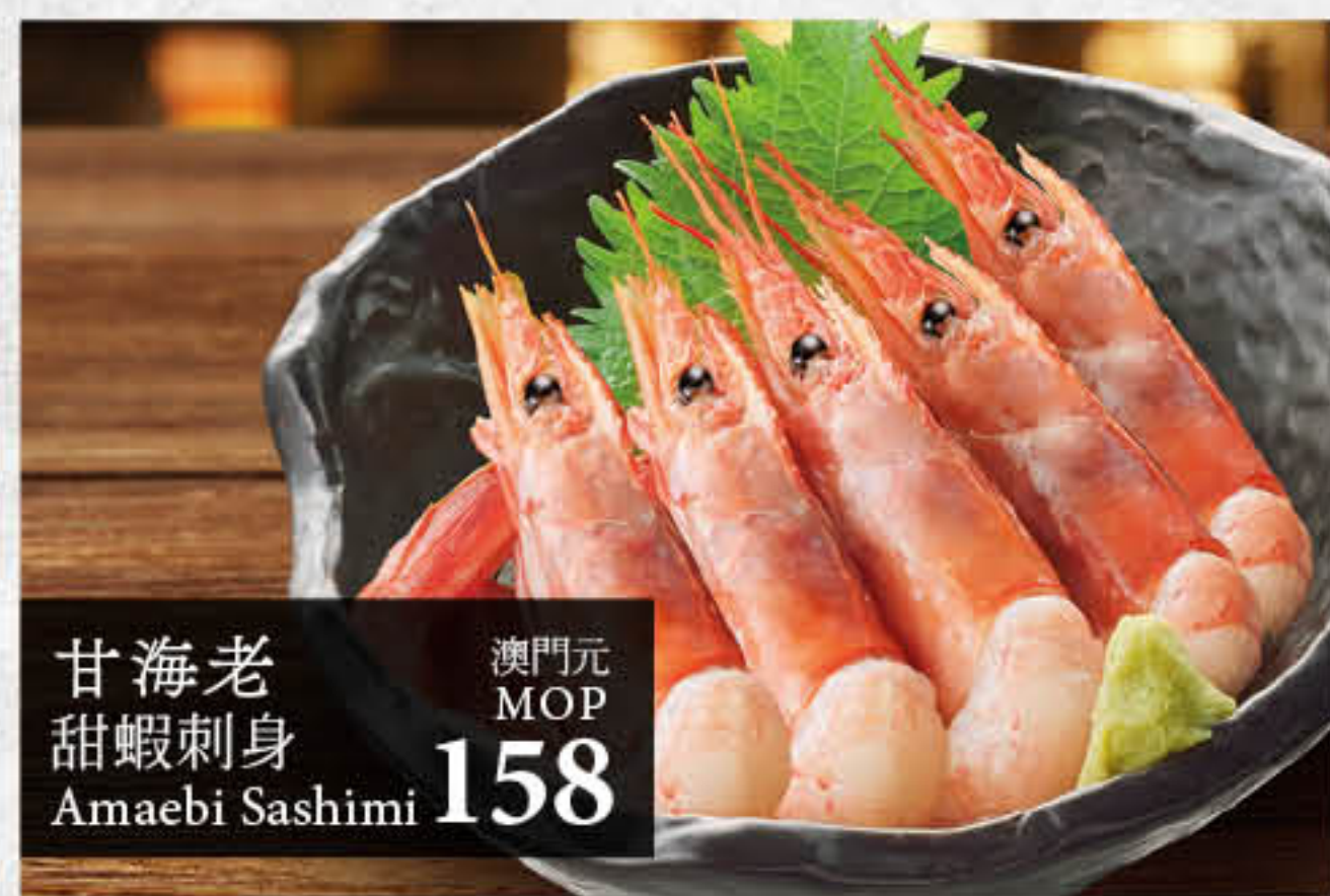
甘海老 甜蝦刺身 Amaebi Sashimi 澳門元 MOP 158