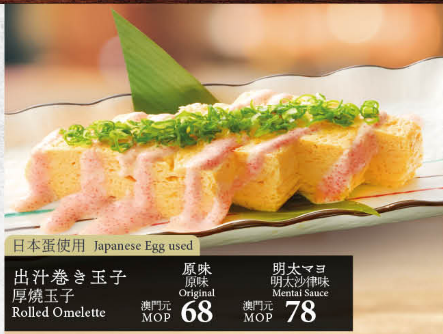
日本蛋使用 Japanese Egg used 出汁巻き玉子 厚燒玉子 Rolled Omelette 原味 Original 明太マヨ 明太沙律味 Mentaï Sauce 澳門元 MOP 68 / 澳門元 MOP 78