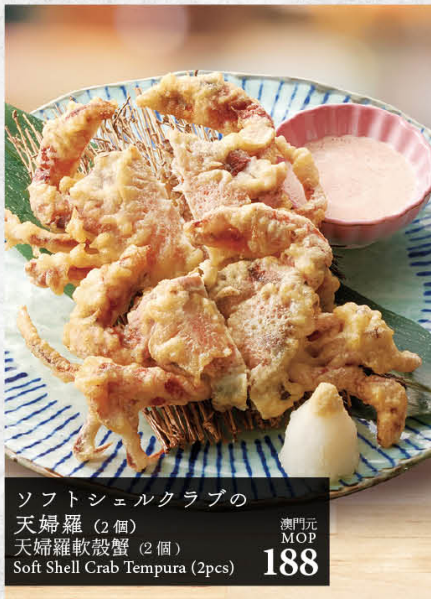
ソフトシェルの 天婦羅 (2個) 天婦羅軟殼蟹 (2個) Soft Shell Crab Tempura (2pcs) 澳門元 MOP 188