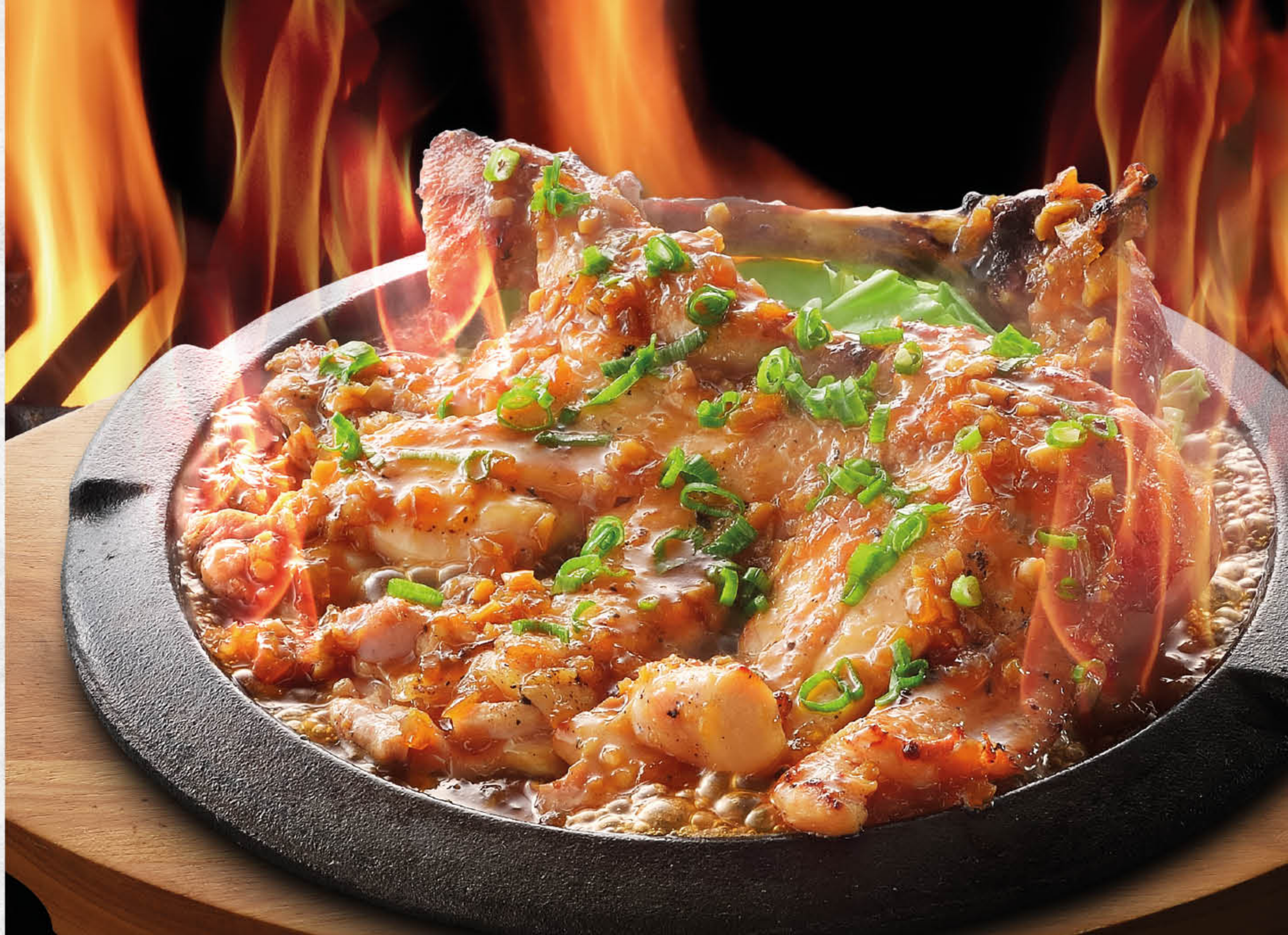
ジャンボ骨付き鶏モモの炙り焼き 火焰炙燒珍寶雞腿 Grilled Jumbo Thigh