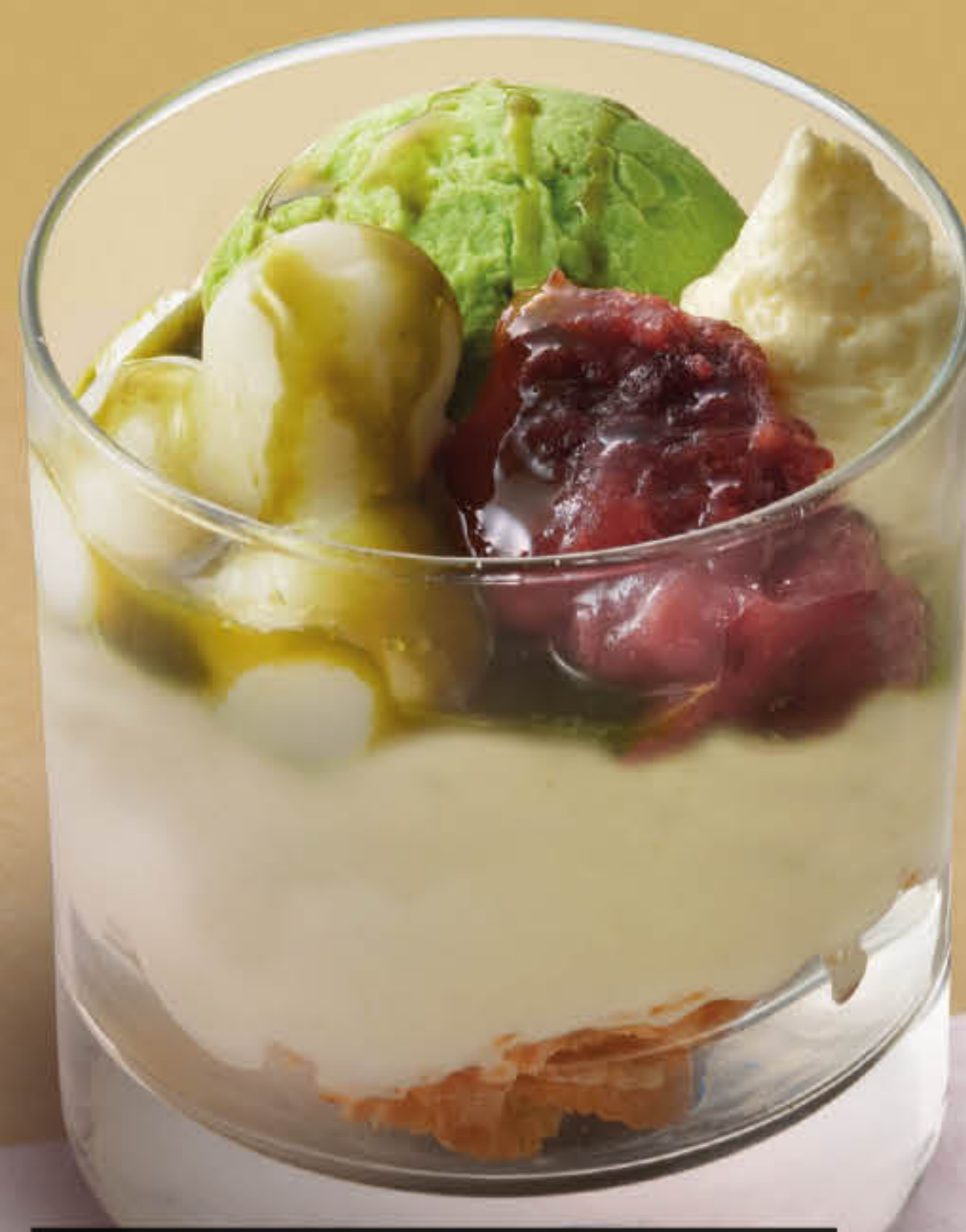
抹茶白玉ぜんざいのパフェ 抹茶白玉紅豆芭菲 Matcha & Red Beans Parfait 澳門元 MOP 68