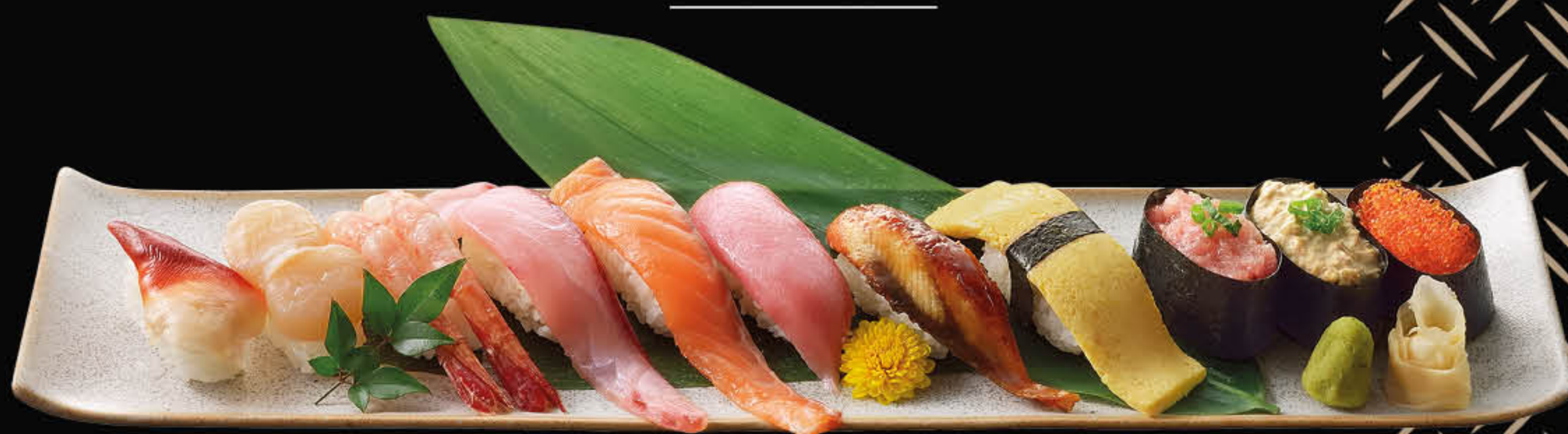
特上寿司盛合せ 特上壽司盛合 Special Assorted Sushi 澳門元 MOP 368

鮮度の高い握り寿司はもちろん、 ここでしか食べられない創作寿司は 「饗和民」の人気商品です。 除了鮮度極高的手握壽司之外， 「饗和民」獨一無二的創作壽司 也是我們的人氣商品。