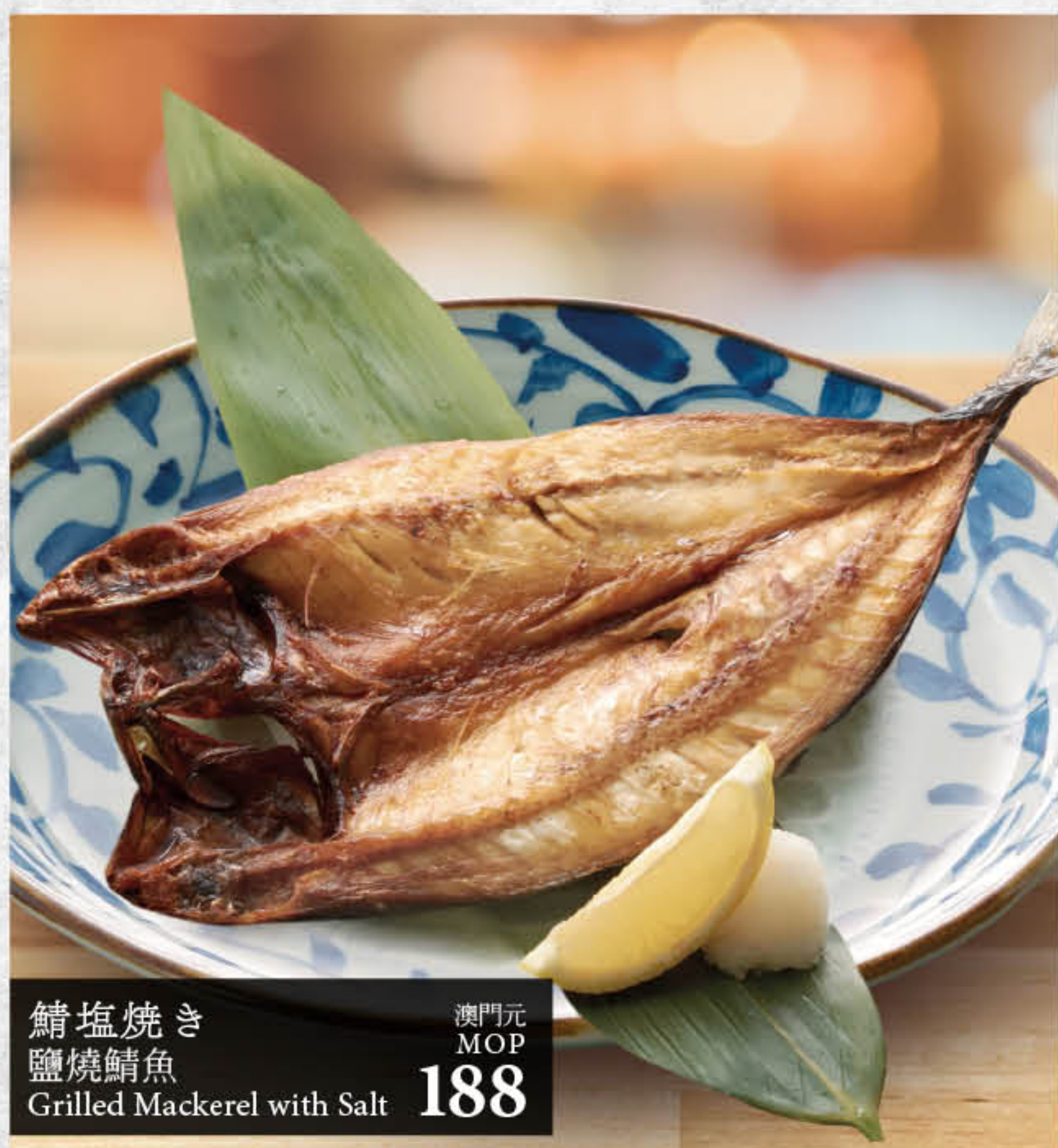
鯖塩焼き 鹽燒鯖魚 Grilled Mackerel with Salt