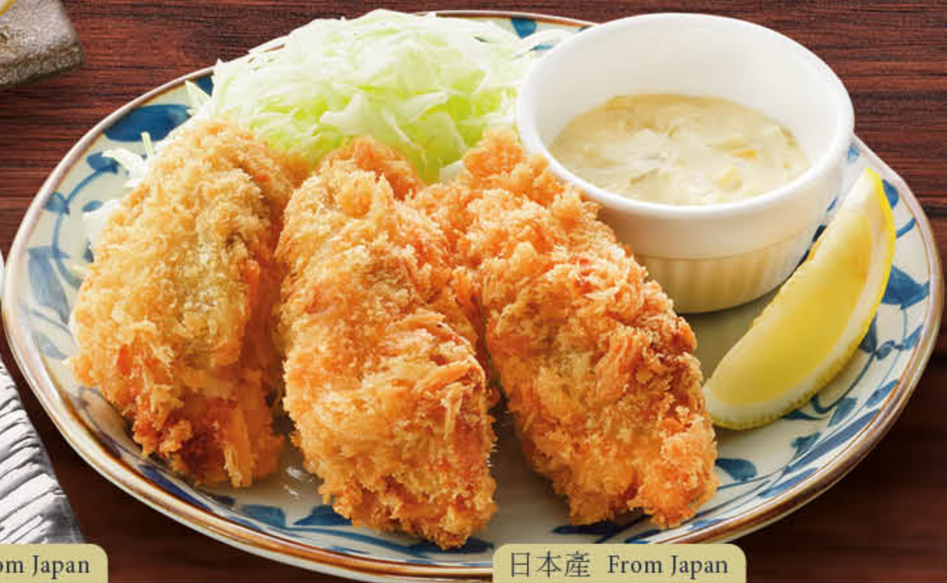
日本産 From Japan 広島県産 カキフライ (3個) 広島県産! 脆炸牡蠣 (3個) Deep Fried Hiroshima Oysters (3pcs) 澳門元 MOP 78