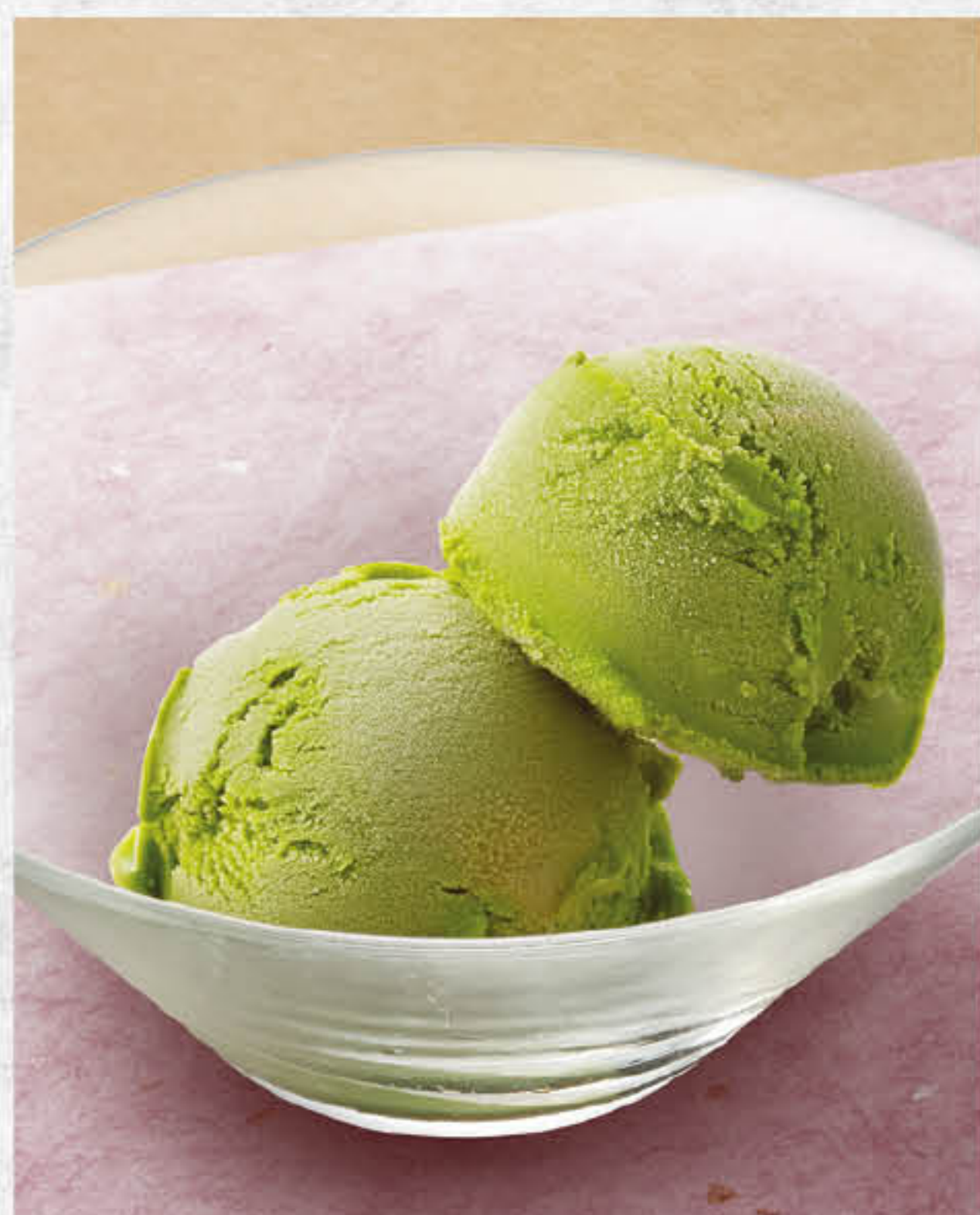
抹茶のアイスクリーム (2個) 抹茶雪糕 (2個) Matcha Ice-cream (2 Scoops) 澳門元 MOP 58