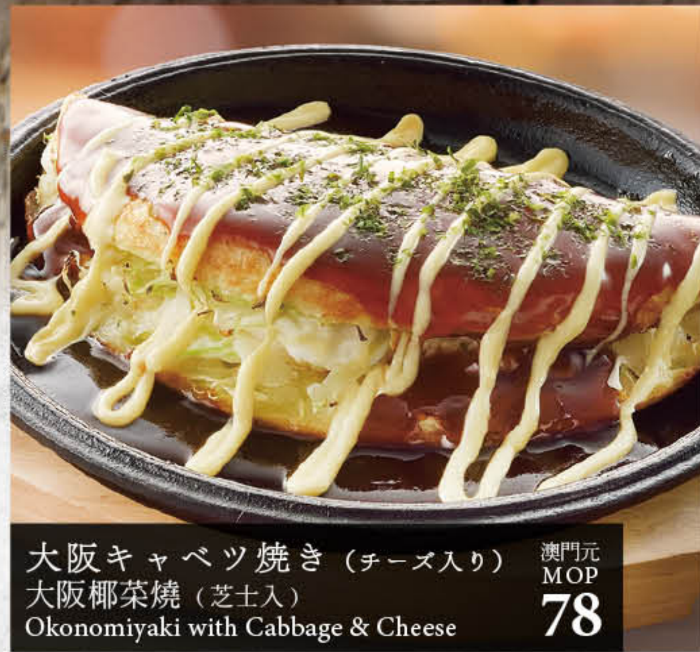
大阪キャベツ焼き(チーズ入り) 澳門元 MOP 78 大阪椰菜燒(芝士入) Okonomiyaki with Cabbage & Cheese