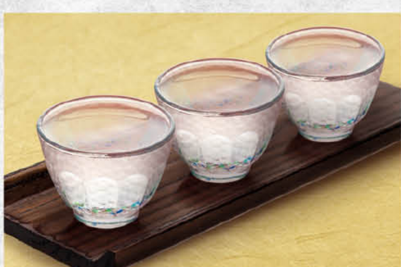
特上日本酒セット 二嗜日本酒 Set 澳門元 MOP 98