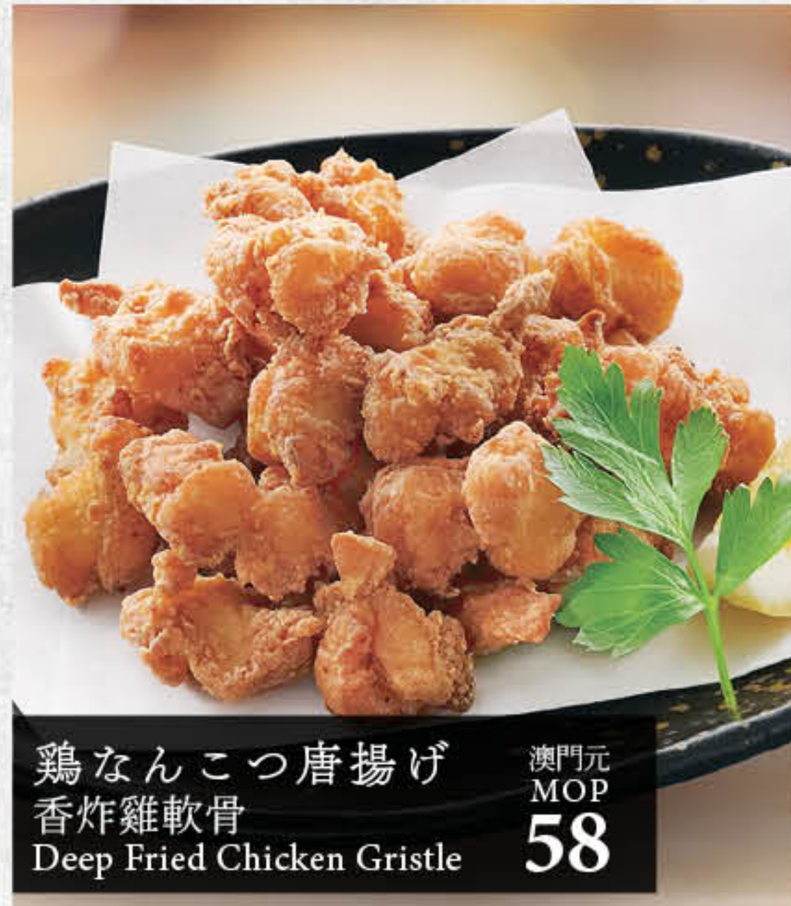
鶏なんこつ唐揚げ 香炸雞軟骨 Deep Fried Chicken Gristle 澳門元 MOP 58