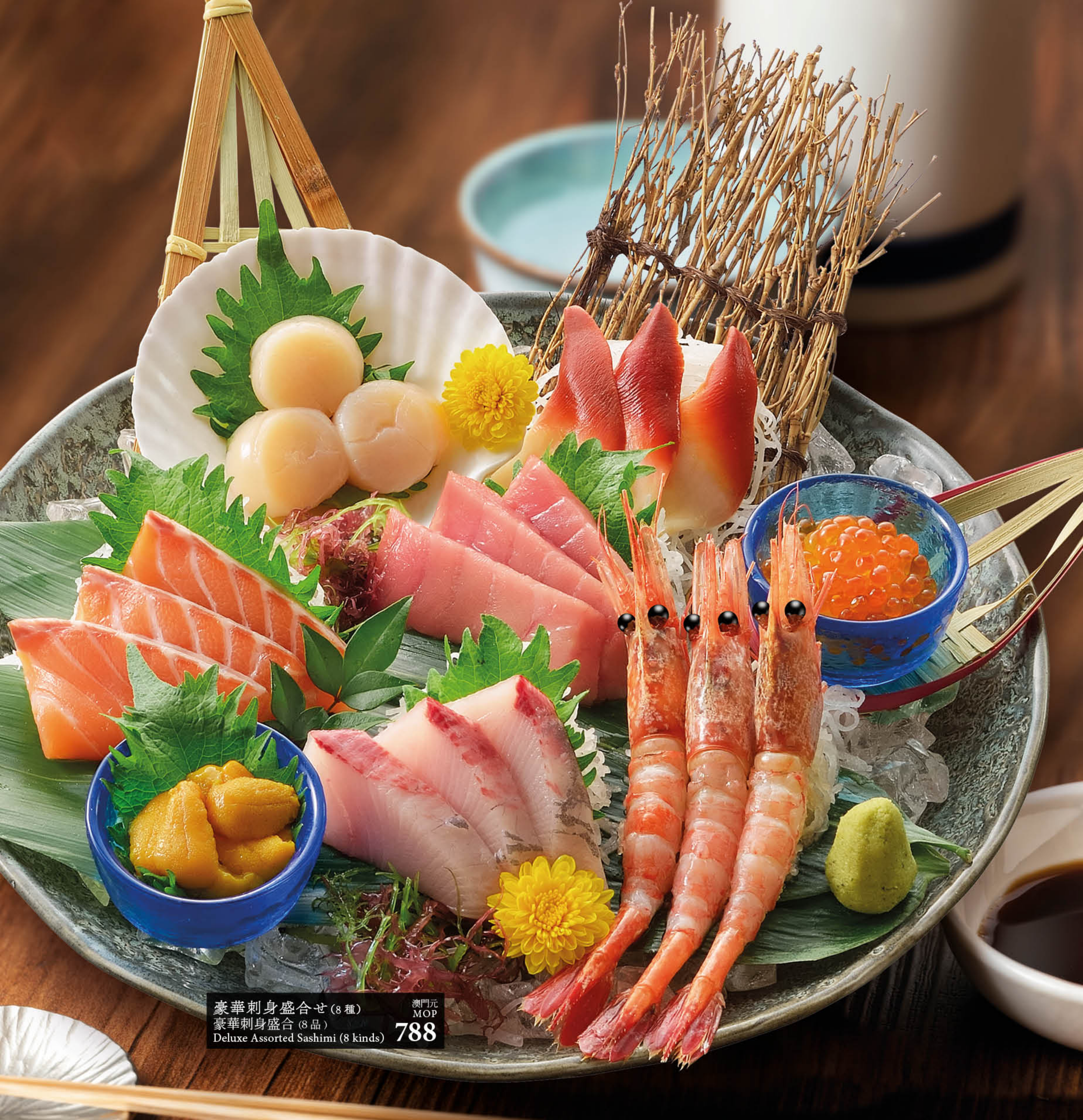
豪華刺身盛合せ (8種) 澳門元 MOP 788 豪華刺身盛合 (8品) Deluxe Assorted Sashimi (8 kinds)