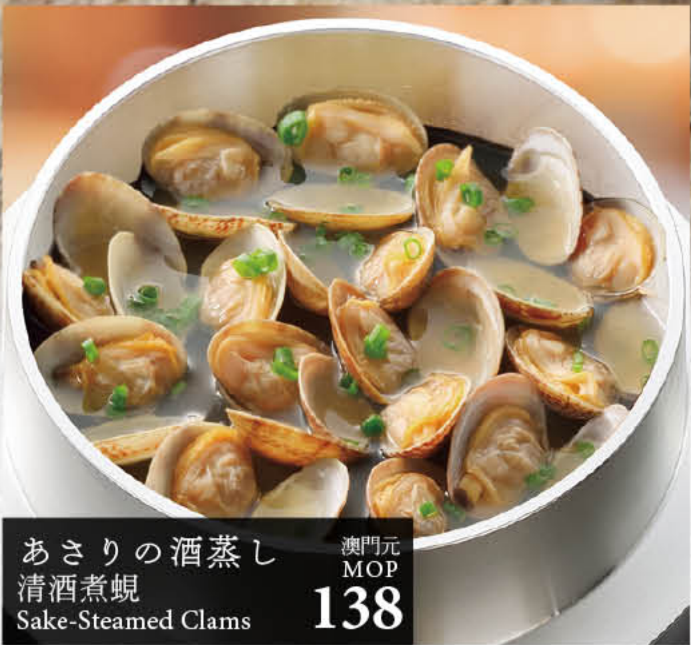
あさりの酒蒸し 澳門元 MOP 138 清酒煮蜆 Sake-Steamed Clams