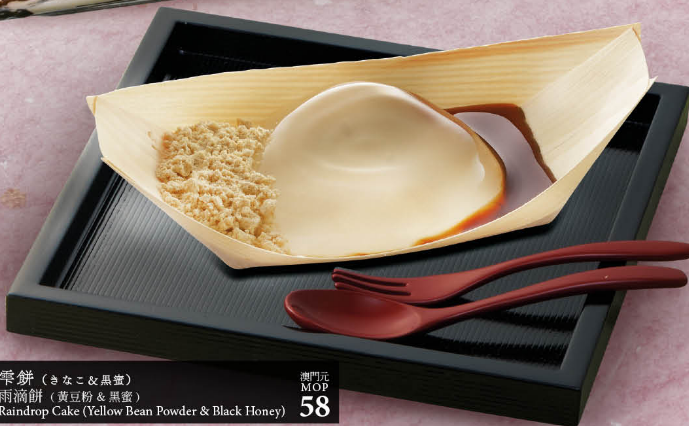
雫餅 (きなこ&黒蜜) 雨滴餅 (黃豆粉&黒蜜) Raindrop Cake (Yellow Bean Powder & Black Honey) 澳門元 MOP 58