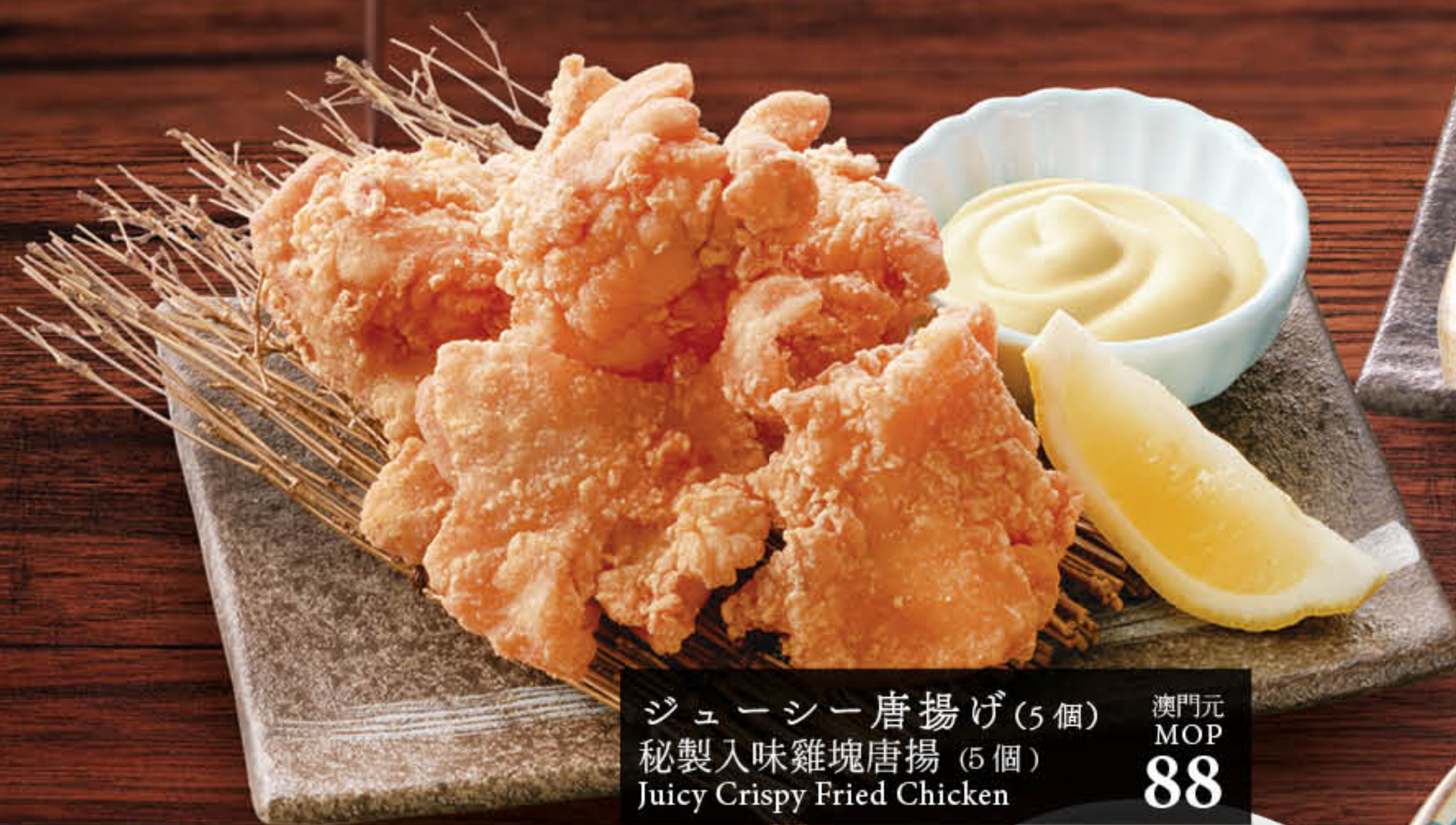
ジューシー唐揚げ (5個) 秘製入味雞塊唐揚 (5個) Juicy Crispy Fried Chicken 澳門元 MOP 88