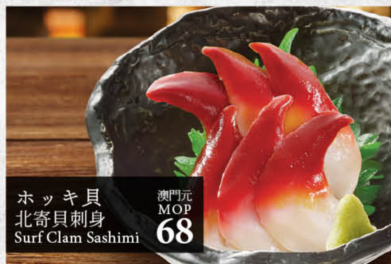
ホッキ貝 北寄貝刺身 Surf Clam Sashimi 澳門元 MOP 68