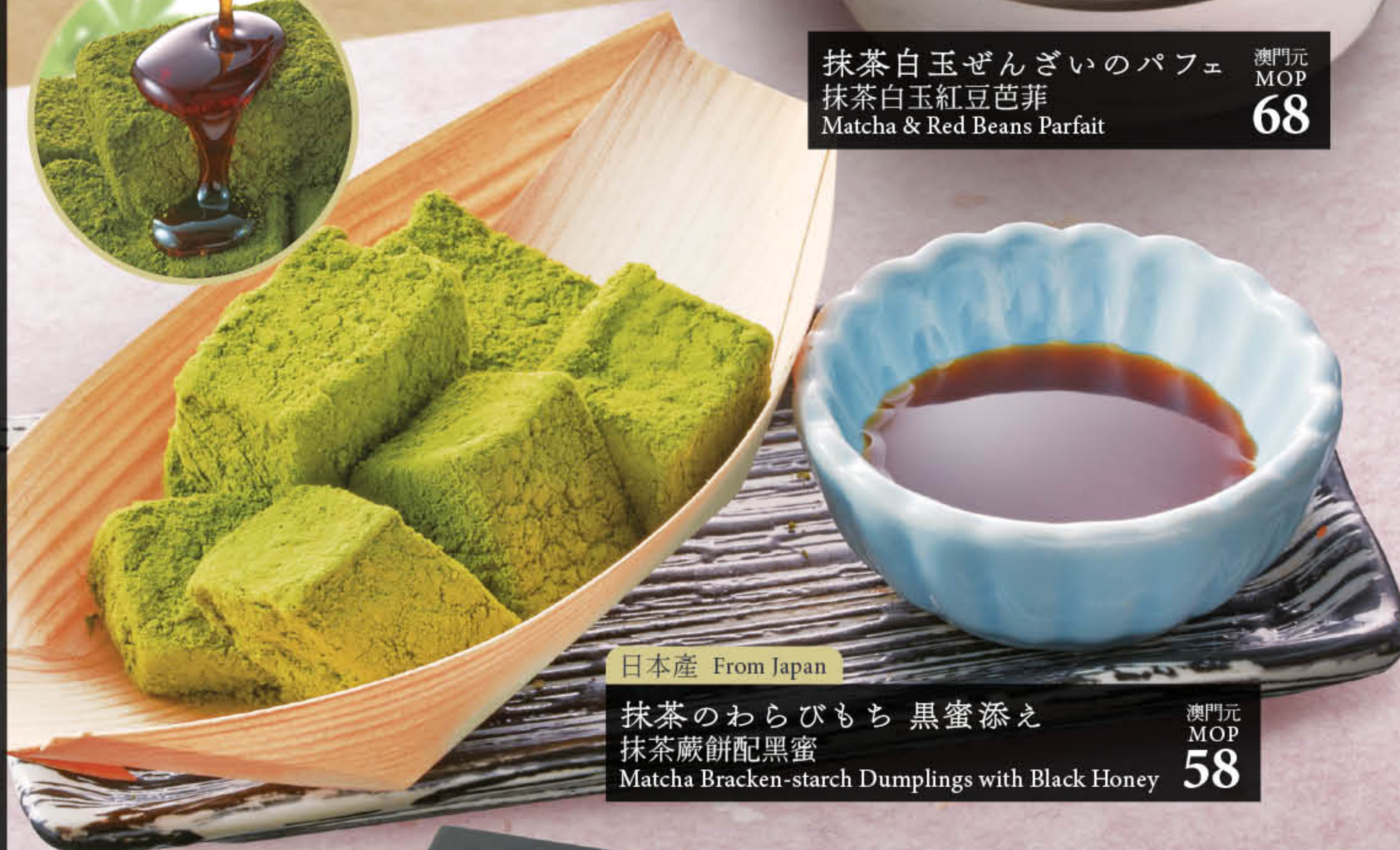
日本産 From Japan 抹茶のわらびもち 黒蜜添え 抹茶蕨餅配黒蜜 Matcha Bracken-starch Dumplings with Black Honey 澳門元 MOP 58