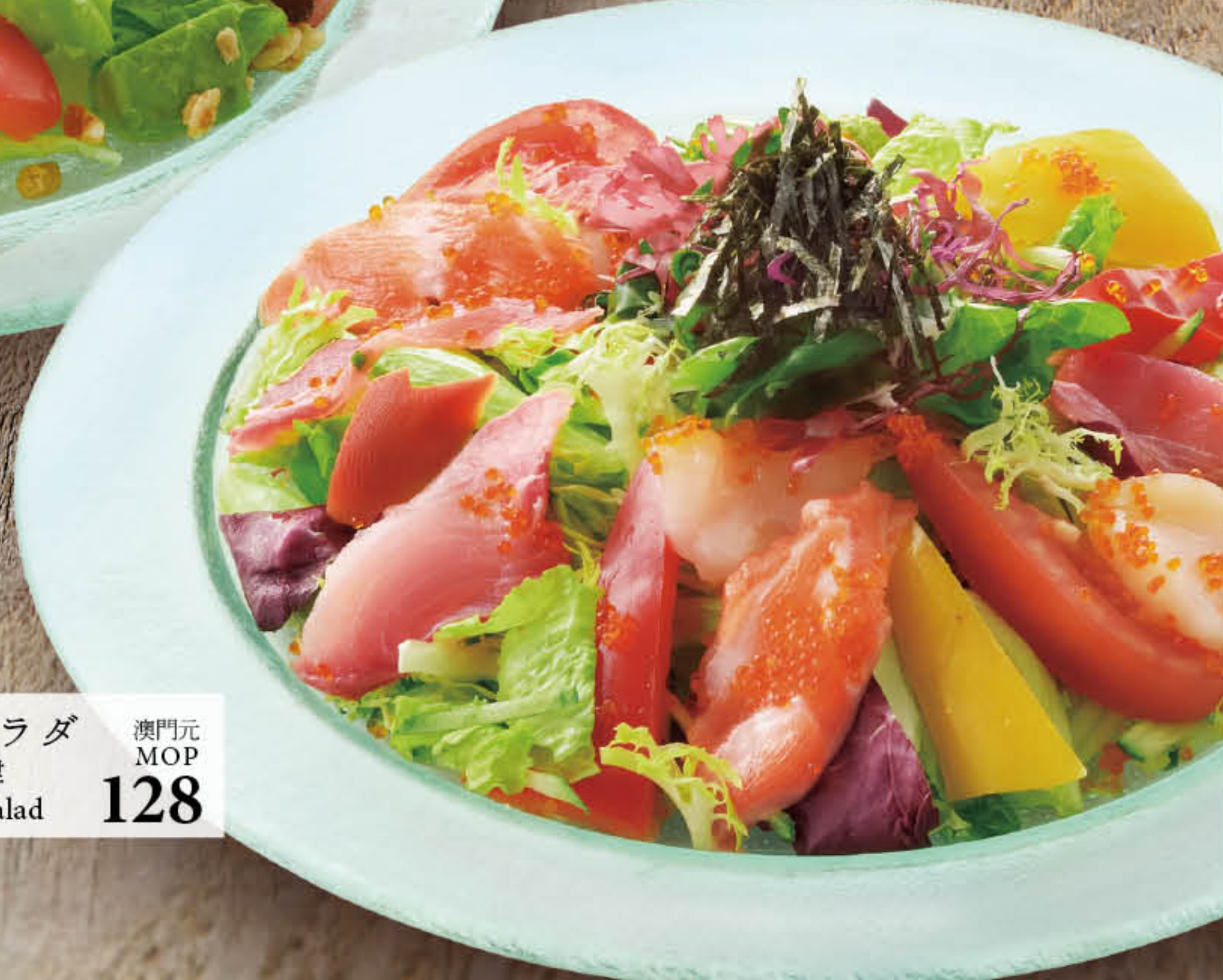
海鮮サラダ 澳門元 MOP 128 海鮮沙律 Seafood Salad