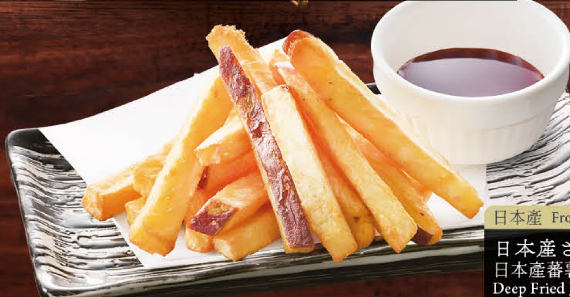
日本産 From Japan 日本産 さつま芋 日本産 蕃薯條 Deep Fried Japanese Sweet Potato Stick 澳門元 MOP 58