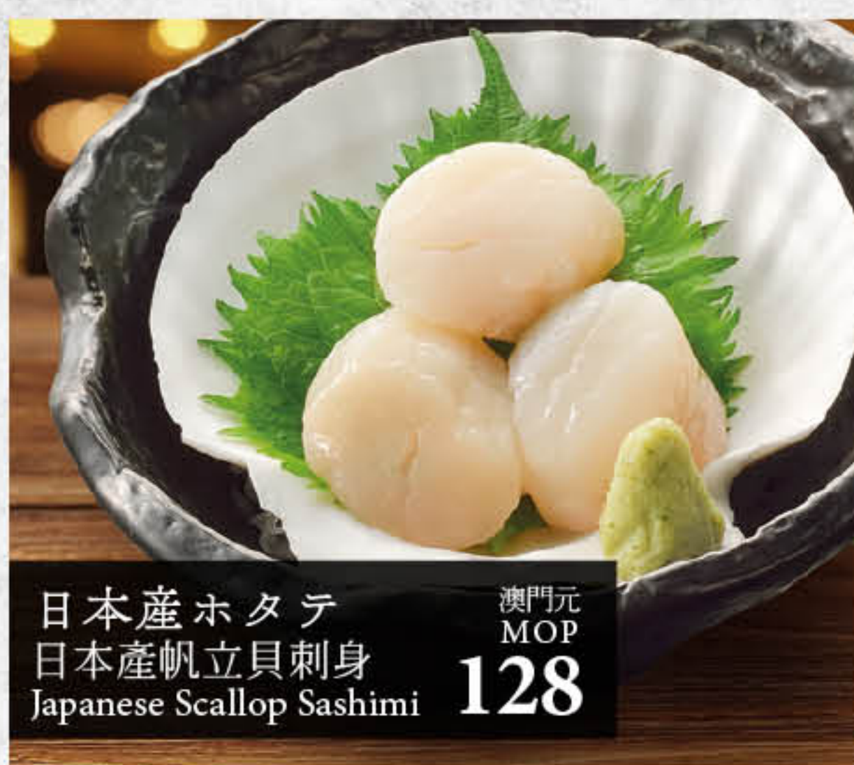
日本産ホタテ 日本産帆立貝刺身 Japanese Scallop Sashimi 澳門元 MOP 128