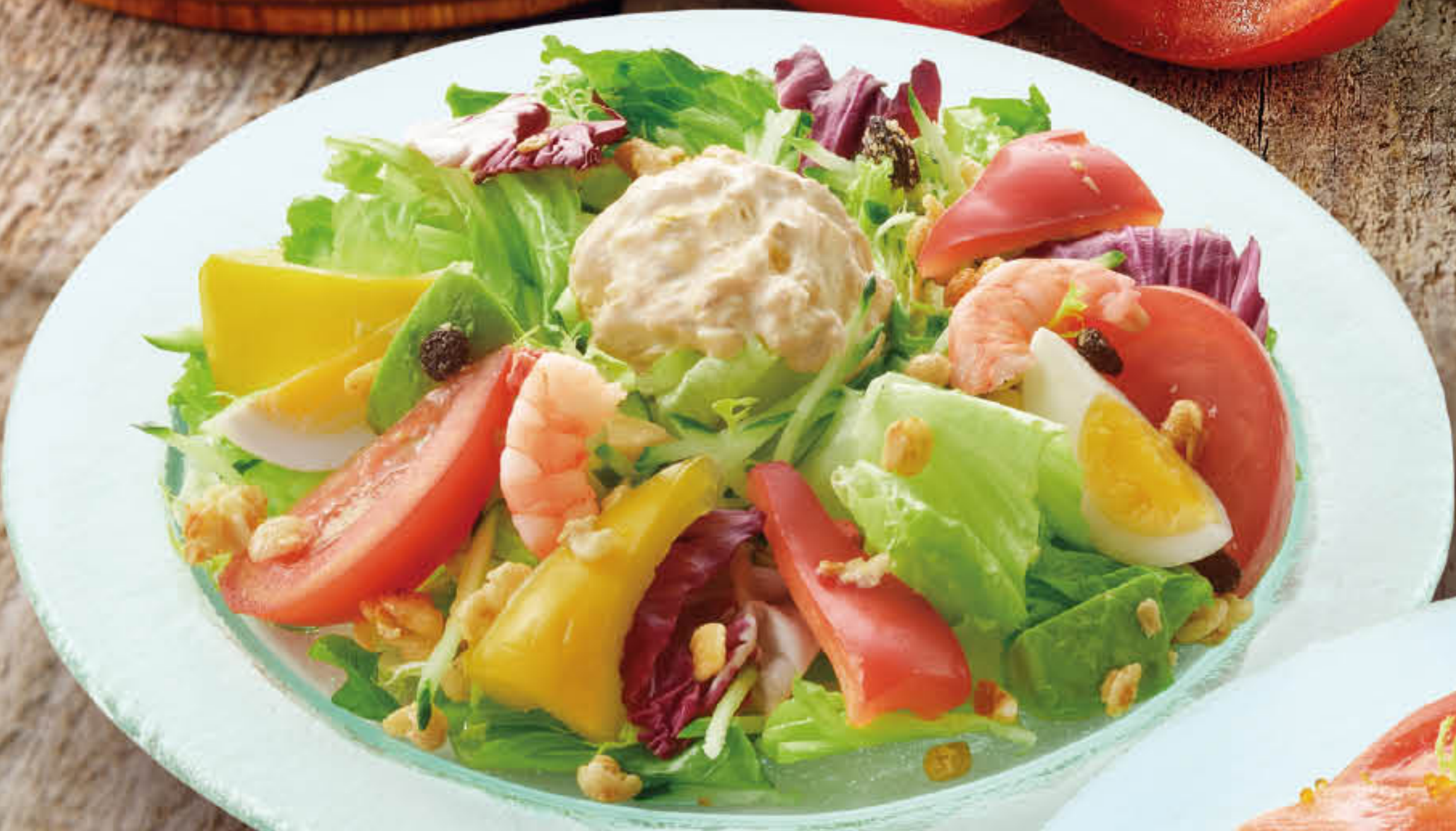
饗・和民サラダ 澳門元 MOP 118 饗・和民沙律 KYO Watami Salad