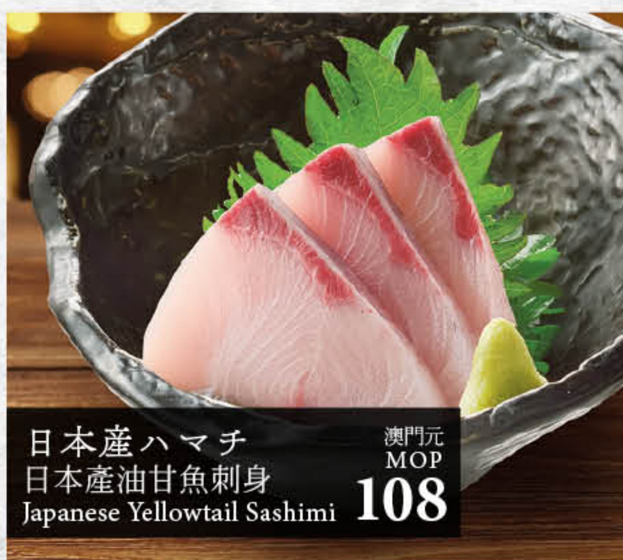
日本産ハマチ 日本産油甘魚刺身 Japanese Yellowtail Sashimi 澳門元 MOP 108